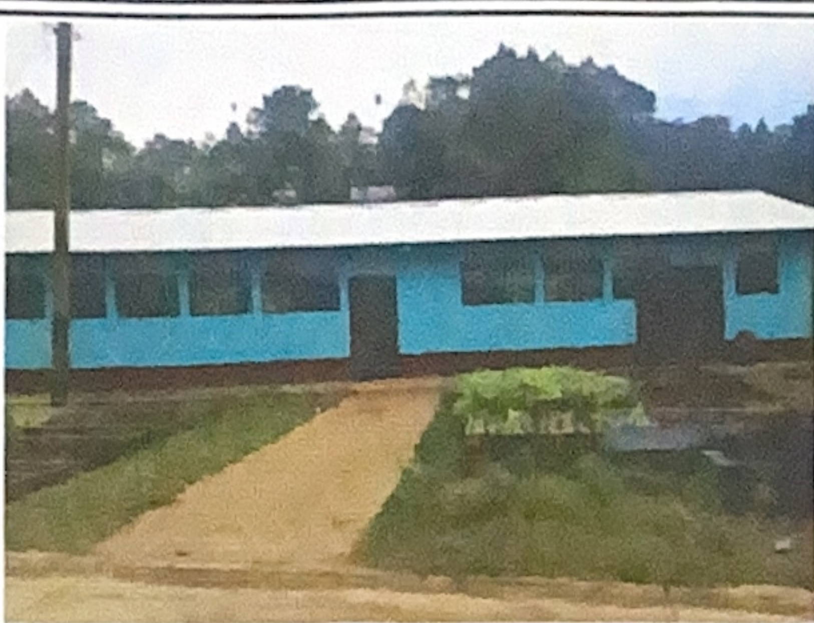
Foto1: Se pinto la escuela y las aulas.